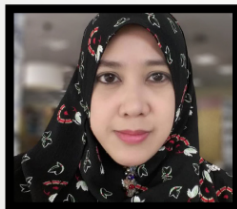
Nukilan Nadia Zex Perpustakaan UMP