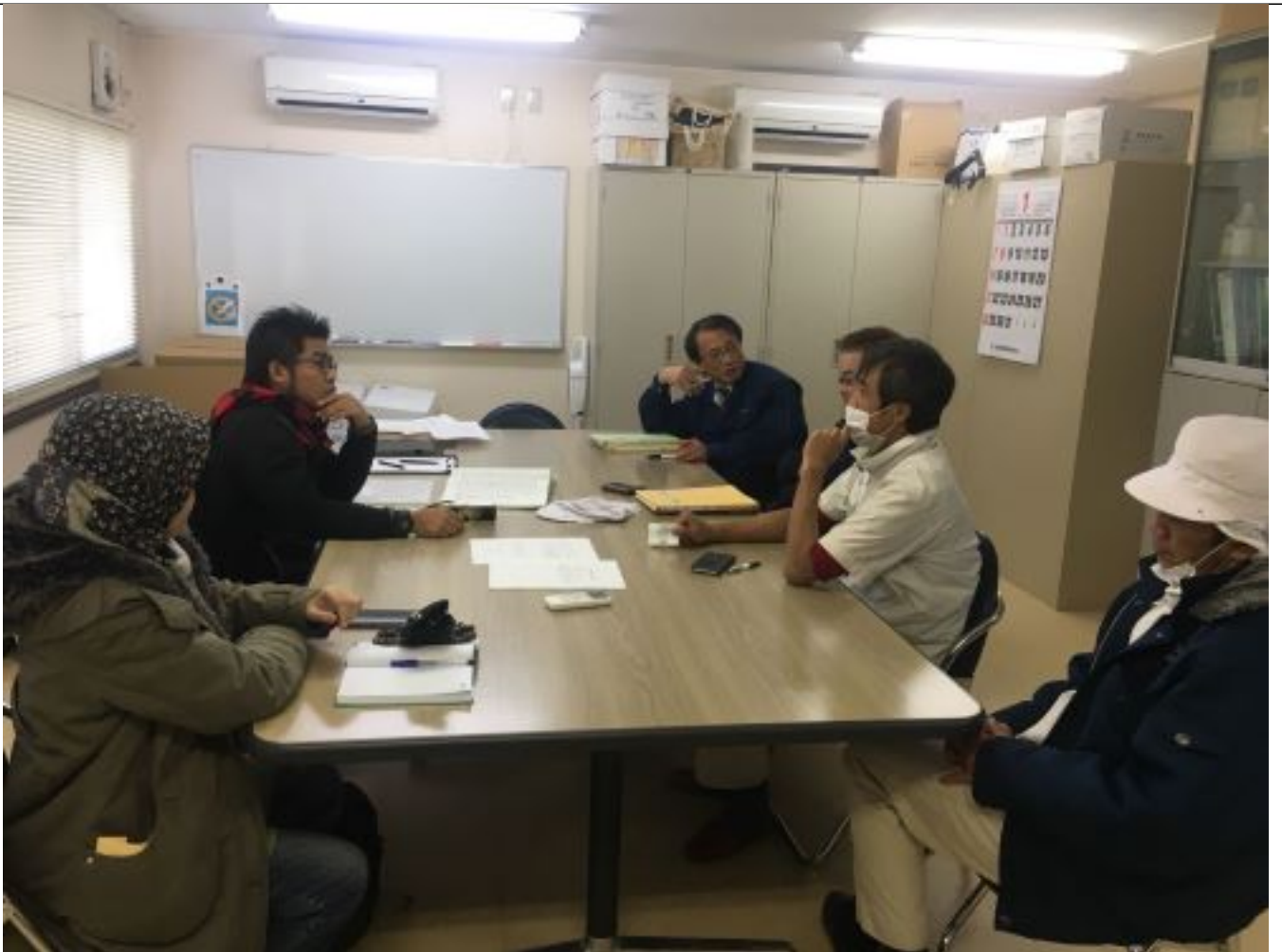
Perbincangan bersama Pengurusan Atasan Zenkai Meat Corporation