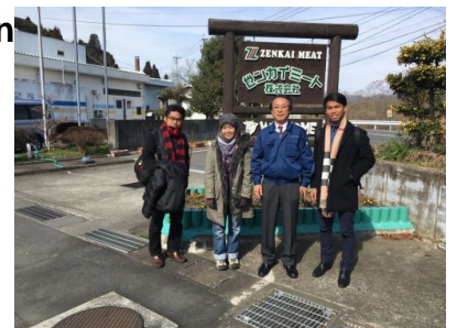
Bergambar bersama Pengurusan Atasan Zenkai Meat Corporation dan auditor MPJA