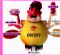
BERAT BADAN BERLEBIHAN