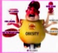
BERAT BADAN BERLEBIHAN