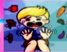
KURANG PENGAMBILAN SAYUR DAN BUAH