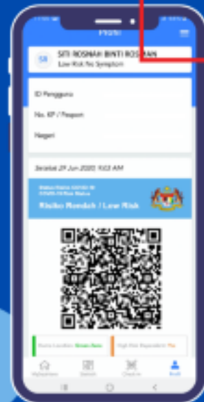
LANGKAH 2 TEKAN BUTANG 'ATURAN'