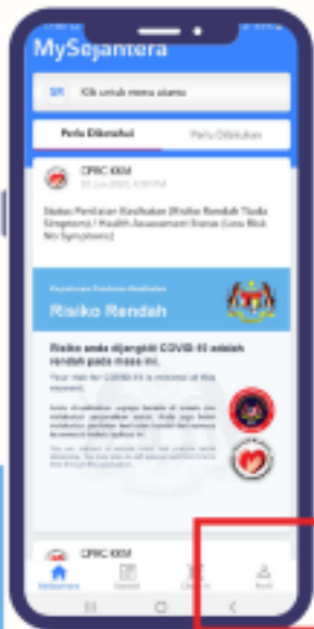
LANGKAH 1 TEKAN BUTANG 'PROFIL'