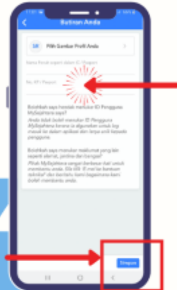
LANGKAH 4 KEMAS KINI MAKLUMAT ANDA & TEKAN BUTANG 'SIMPAN'