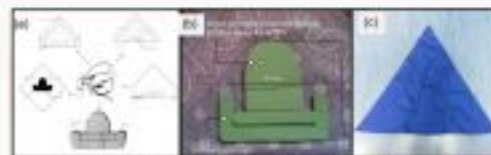
Modification of traditional bandana for the first prototype

A novel protective bandana with shock absorbing material (Polyurethane) was created based on anthropometry data that suits not only forehead, but whole frontal region.