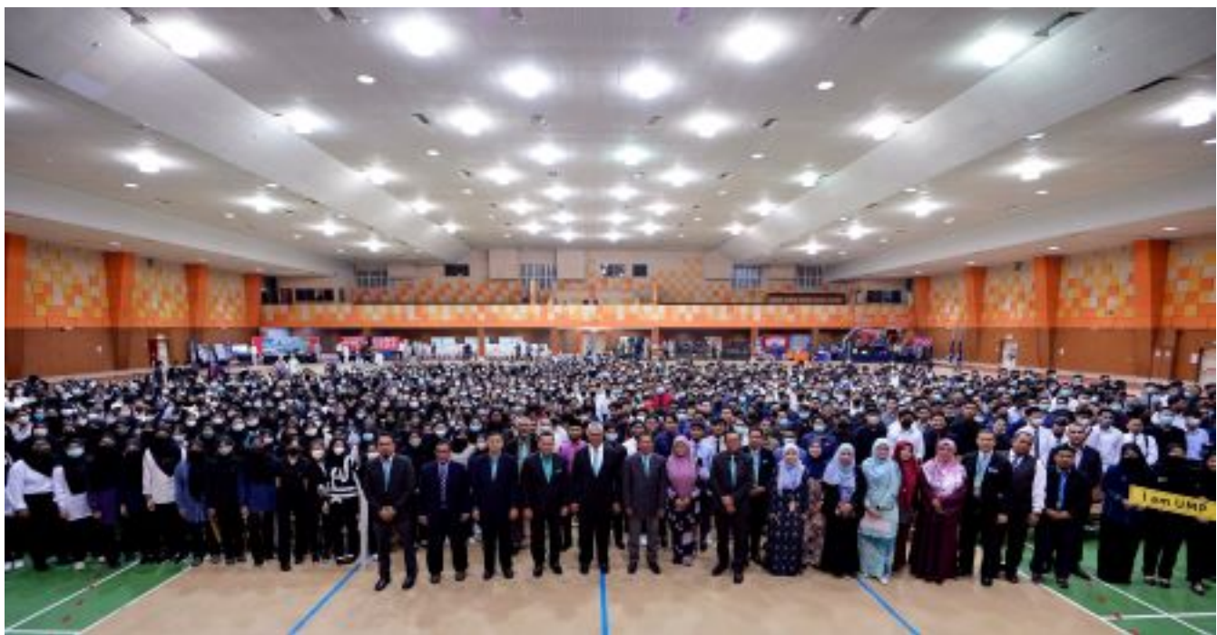
Generasi muda perlu sokongan moral daripada masyarakat dan negara

Kata pepatah Melayu, 'hujan emas di negara orang, hujan batu di negeri sendiri'. Pepatah ini membawa masyarakat kita untuk berfikir adakah kita perlu mengorbankan tanah air sendiri demi mengejar kesenangan di negara orang. Dalam konteks ini, generasi baharu yang telah berjaya menggenggam segulung ijazah perlu menyumbang tenaga untuk negara, walaupun peluang di negara orang sentiasa terbuka. Generasi baharu perlu menjadi warganegara yang berasa bertanggungjawab kepada negara, kerana kerajaan dan negara telah memberikan mereka peluang untuk menimba ilmu, jadi sebaiknya jadilah warganegara yang mengenang budi kepada negara kerana tanpa mereka, mungkin negara kehilangan satu permata yang mampu memancarkan aura pembangunan negara.