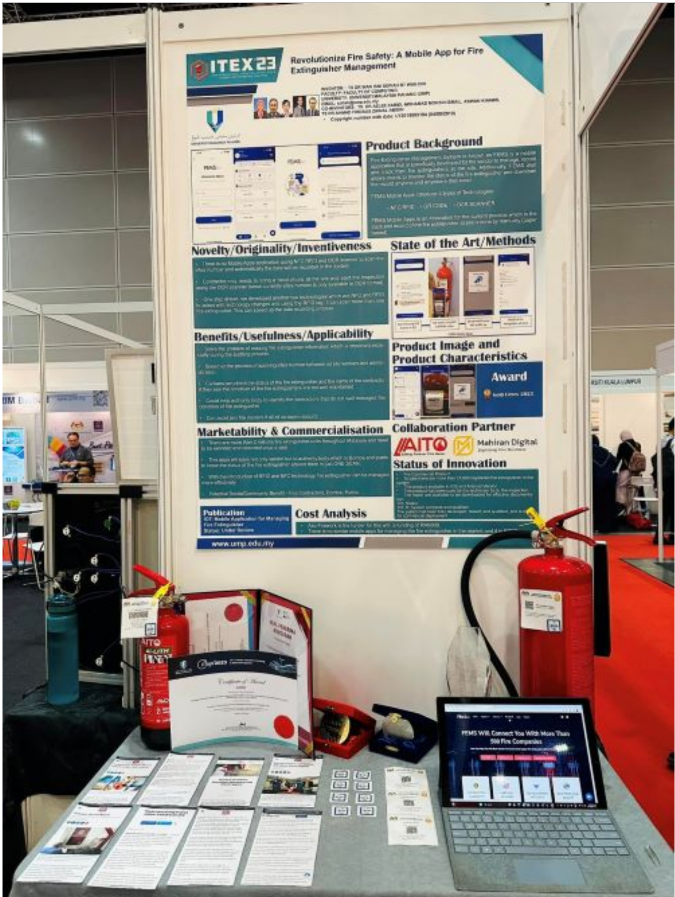
Aplikasi mudah alih Fire Extinguisher Management System (FEMS) yang menggunakan Near Field Communication (NFC) , pengimbas Optical Character Recognition (OCR) , kod Respons Pantas (QR) dan teknologi Radio Frequency Identification (RFID) direka untuk menyediakan penyelesaian yang komprehensif bagi menguruskan alat pemadam api.