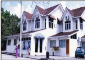
PUSAT SUMBER, UTM-KCP