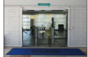
BILIK BACAAN, KAMPUS PEKAN