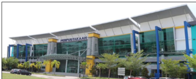
PERPUSTAKAAN UMPSA KAMPUS PEKAN