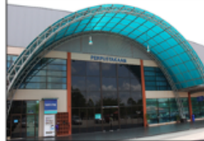
PERPUSTAKAAN UMP, GAMBANG