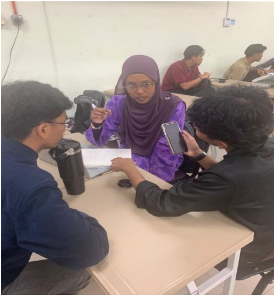
Chat GPT akan menguasai dunia