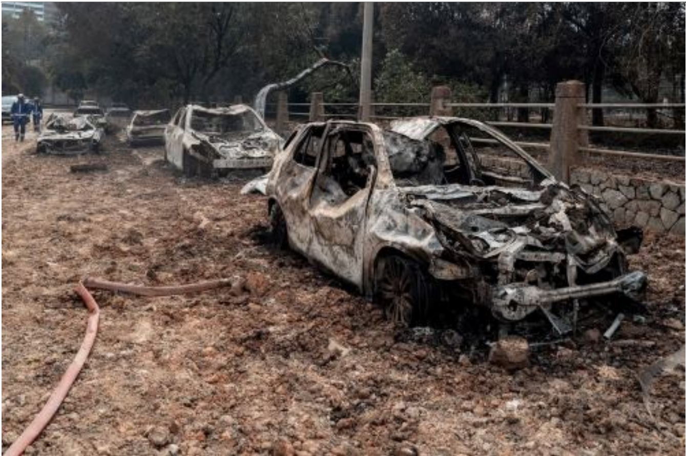
Kerosakan teruk pada rangka kenderaan yang berhampiran dengan pusat letupan akibat haba yang tinggi.