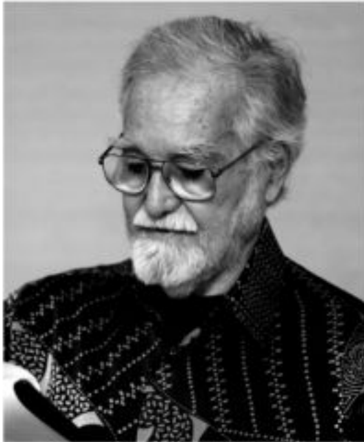
Allahyarham Profesor Diraja Ungku Abdul Aziz Ungku Abdul Hamid