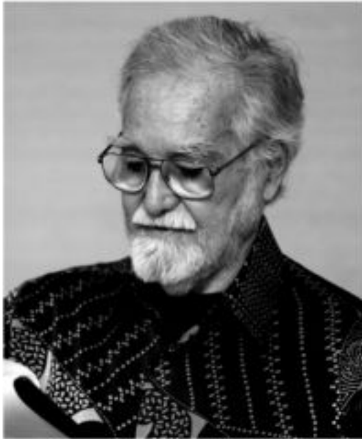
Allahyarham Profesor Diraja Ungku Abdul Aziz Ungku Abdul Hamid