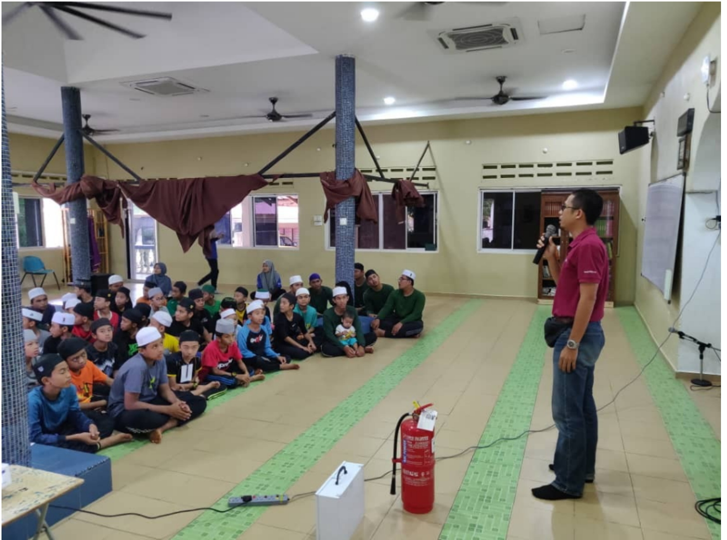
Program sinergi di Madrasah Tahfiz Anwarul Tanzil al-Othmaniah, Bukit Goh, Kuantan bersama pensyarah, pelajar, Pejabat Pengurusan Keselamatan dan Kesihatan Pekerjaan (OSHMO), OSH Club UMP dan Malaysian Society for Occupational Safety and Health (NGO- MSOSH) Cawangan Pantai Timur.