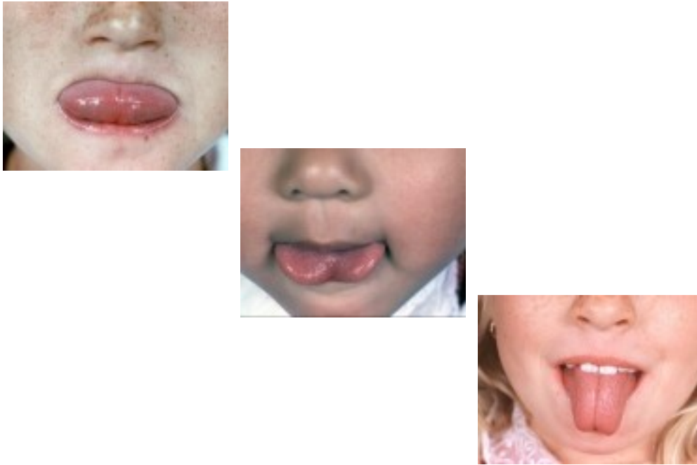
Gambar 2: Hujung lidah berbentuk (a) rata, (b) jantung dan (c) terbelah (Fernando, 2019).