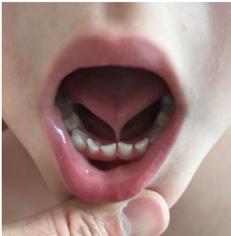
Gambar 1: Jalur tisu antara dasar mulut dan hujung lidah.

Persoalan seterusnya, bagaimana cara mengesan lidah pendek? Lidah pendek atau tongue tie ( ankyloglossia ) boleh dikesan seawal bayi dilahirkan. Sama ada ibu bapa melihat sendiri bahagian bawah lidah bayi anda atau dapatkan bantuan daripada pakar. Selain itu, terdapat juga gejala lain yang boleh dilihat pada bayi kesan daripada lidah pendek termasuklah bayi gagal atau sukar menghisap puting semasa penyusuan bayi. Ini akan menyebabkan bayi tidak mendapat nutrisi yang cukup dan berat bayi semakin menurun atau statik. Di samping itu juga, puting susu ibu akan luka dan/atau melecet setiap kali menyusu bayi. Jika anda menghadapi salah satu masalah yang dinyatakan, segera berjumpa pakar Telinga, Hidung dan Tekak (ENT) untuk mendapatkan pengesahan dan nasihat.