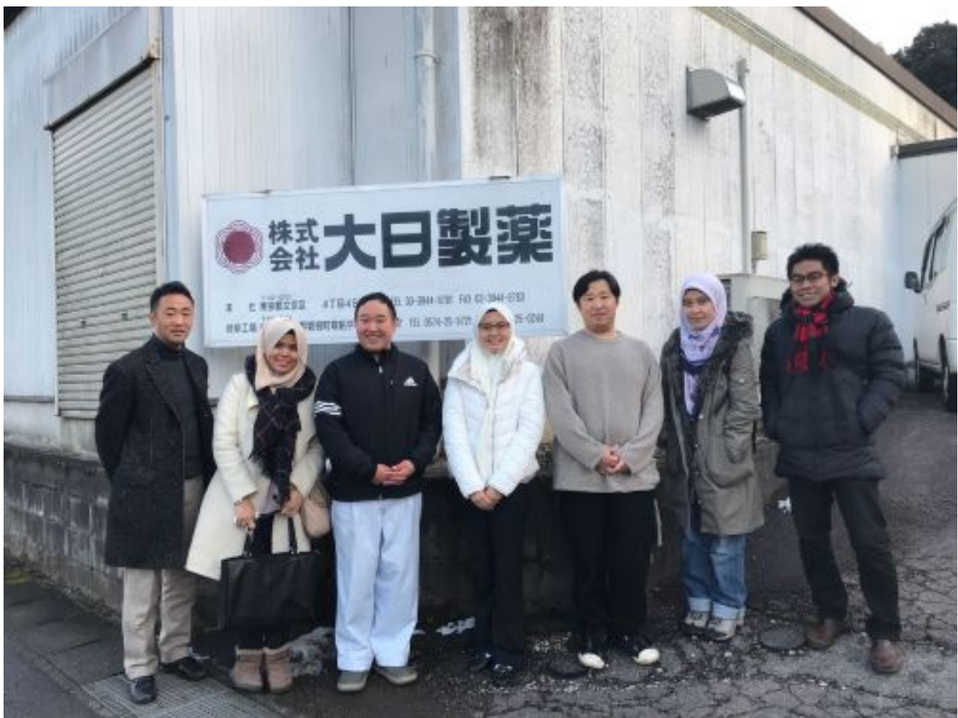
Bergambar bersama Pengurusan Atasan Dainichi Seiyaku Co., Ltd dan auditor MPJA