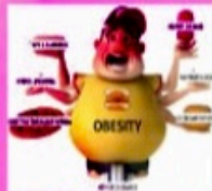
BERAT BADAN BERLEBIHAN