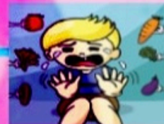
KURANG PENGAMBILAN SAYUR DAN BUAH