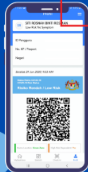
LANGKAH 2 TEKAN BUTANG 'ATURAN'