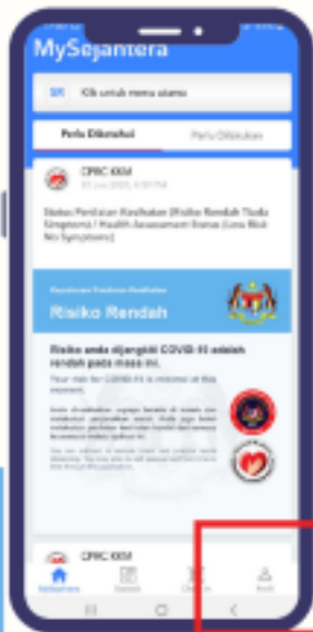
LANGKAH 1 TEKAN BUTANG 'PROFIL'