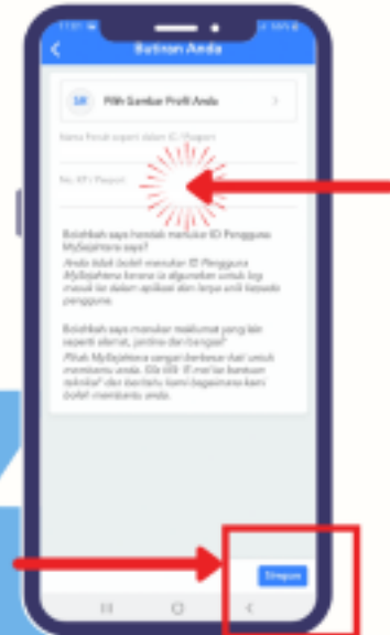
LANGKAH 4 KEMAS KINI MAKLUMAT ANDA & TEKAN BUTANG 'SIMPAN'

KKM patut diberikan pujian dalam usaha mengintegrasikan teknologi and pelaporan sendiri, walaupun terdapat pelbagai kritikan terhadap aplikasi MySejahtera kerana masalah teknikal.