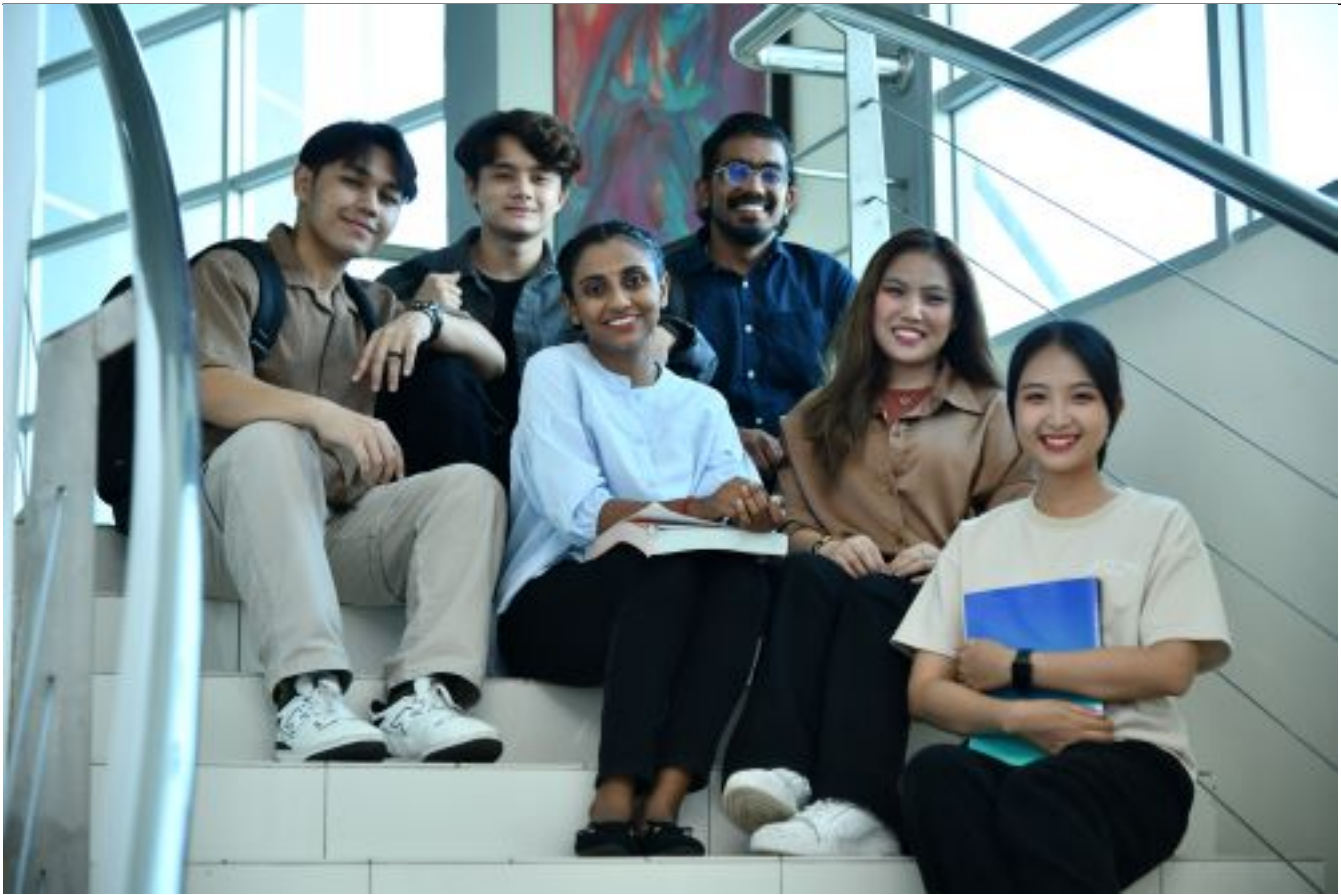
Generasi muda pewaris bangsa dan negara. Sayangilah mereka