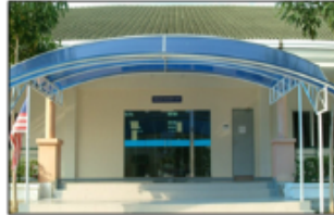
KNOWLEDGE MANAGEMENT CENTER (KMC)