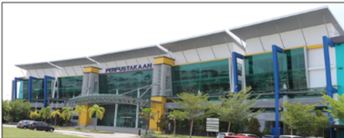
PERPUSTAKAAN UMPSA KAMPUS PEKAN