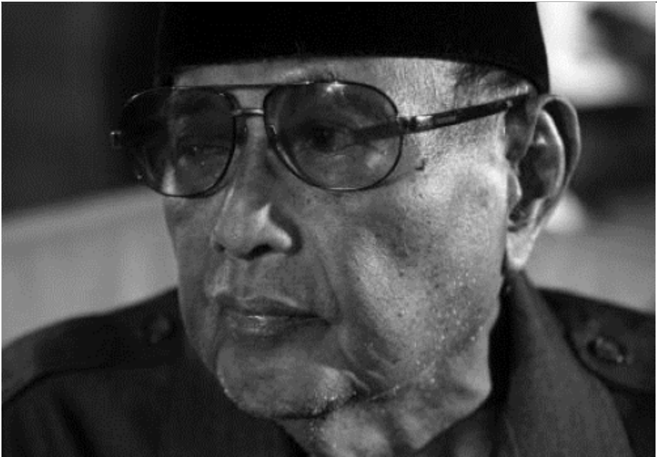
Sumber imej: Jamalul Kiram III

Filipina membuat tuntutan terhadap Sabah kerana Kesultanan Sulu yang berpusat di Filipina, mendakwa memiliki hak ke atas Sabah. Dalam hal ini, Kesultanan Sulu juga mendakwa selain Sabah, beberapa wilayah lain juga menjadi hak mereka seperti Tawi-tawi, Palawan, Basilan, Jolo, Semenanjung Zamboanga dan Basilan di Filipina serta Kepulauan Spratly juga didakwa sebagai hak Kesultanan Sulu.