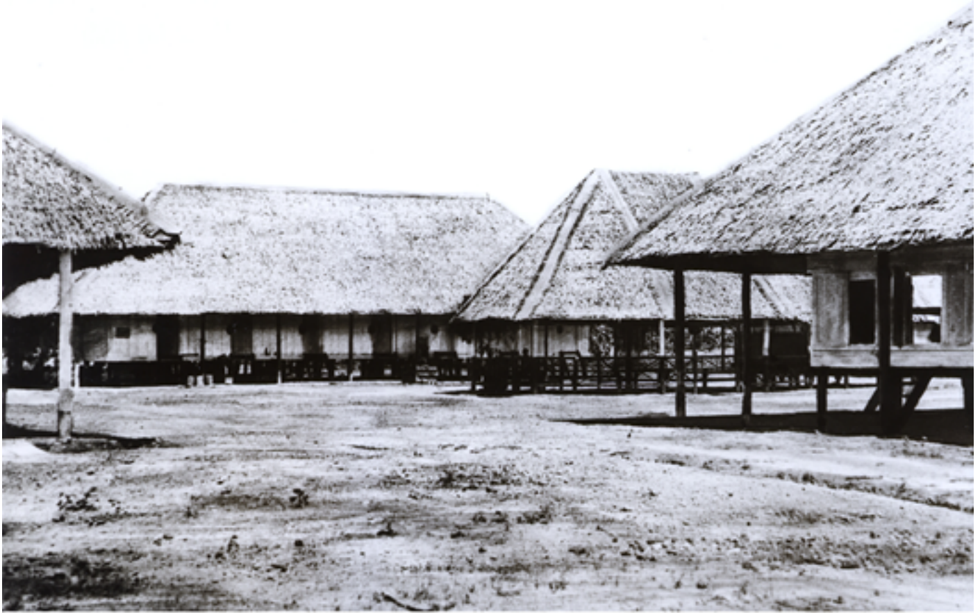
Berek buruh estet getah