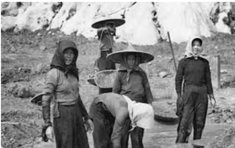
Masyarakat Cina yang bekerja di lombong bijih

Kedatangan British telah mewujudkan perbezaan pembangunan yang ketara di antara kawasan kampung dengan kawasan yang menjadi pusat tumpuan perkembangan ekonomi British. Pengenalan ekonomi perlombongan bijih timah dan perladangan getah telah mewujudkan jaringan sistem perhubungan jalan raya dan jalan kereta api bagi menghubungkan kawasan berkenaan dengan pelabuhan.