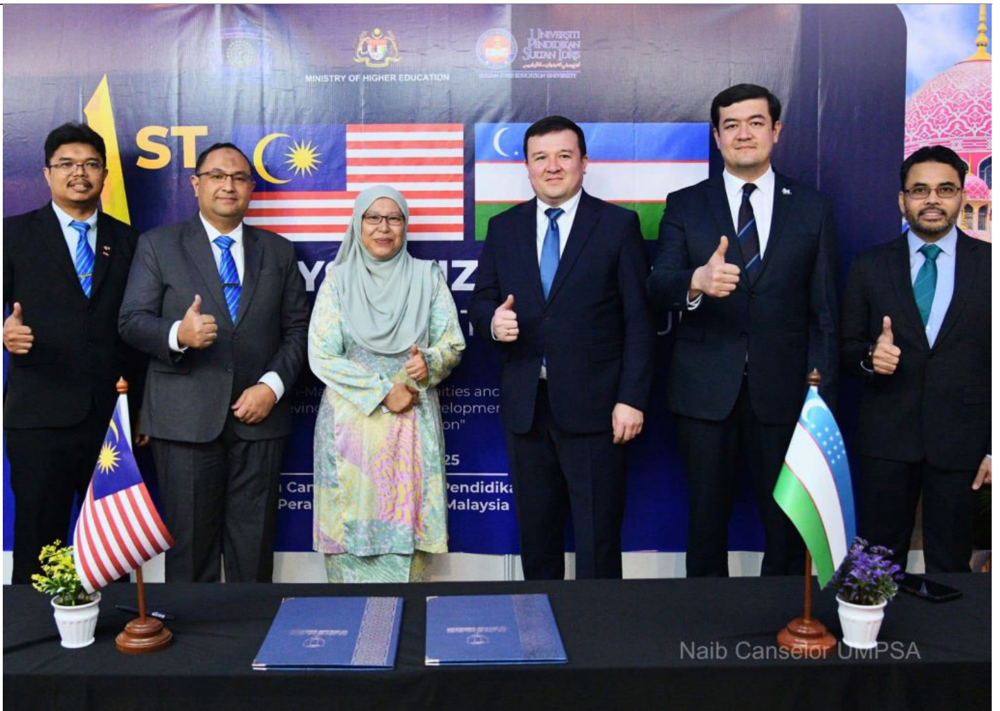
Naib Canselor UMPSA