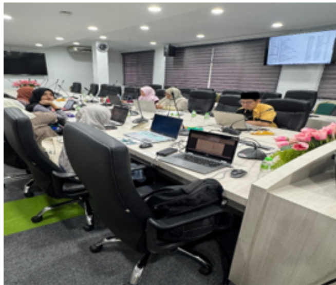
Sesi praktikal Bengkel Jāwī dan Transliterasi Bahasa Arab

Hasil soal selidik yang dijalankan dalam kalangan lapan orang peserta Bengkel J?w? dan Transliterasi Bahasa Arab di UnIPSAS pada 7 Januari 2025 telah menyatakan bahawa keberkesanan perisian AsarFont/JawiAT untuk penulisan J?w? dan transliterasi bahasa Arab secara digital.