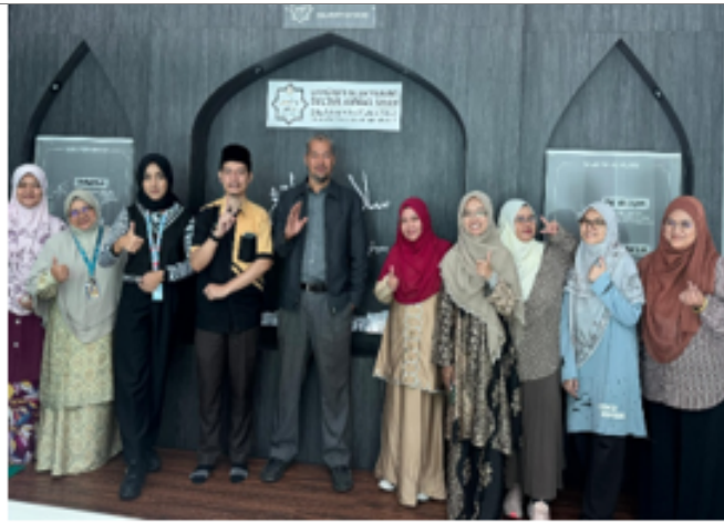
Penceramah bersama para peserta Bengkel Jāwī dan Transliterasi Bahasa Arab di Universiti Islam Pahang Sultan Ahmad Shah (UnIPSAS) pada 7 Januari 2025. Tiga orang daripada para peserta adalah munsyi Jāwī Negeri Pahang