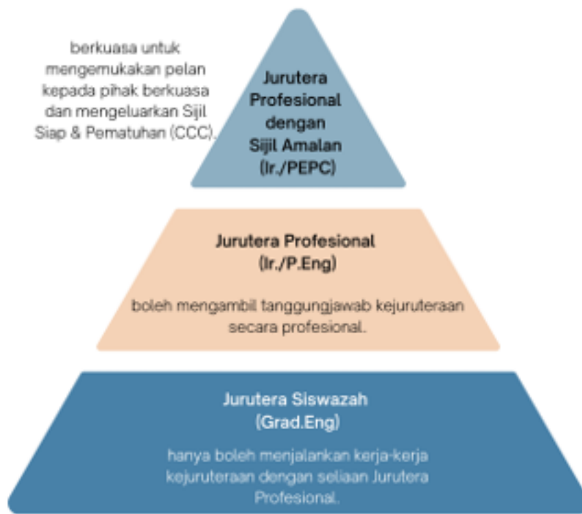
Rajah 2. Hirarki Amalan Kejuruteraan di Malaysia

Rajah 2 menunjukkan hirarki bertingkat pendaftaran profesional dalam bidang Kejuruteraan di Malaysia. Setiap peringkat memberikan hak dan tanggungjawab profesional yang semakin tinggi, dengan kemuncaknya ialah Jurutera Profesional dengan Sijil Amalan (Ir./PEPC) yang mempunyai kuasa untuk mengemukakan pelan dan mengesahkan dokumen rasmi.