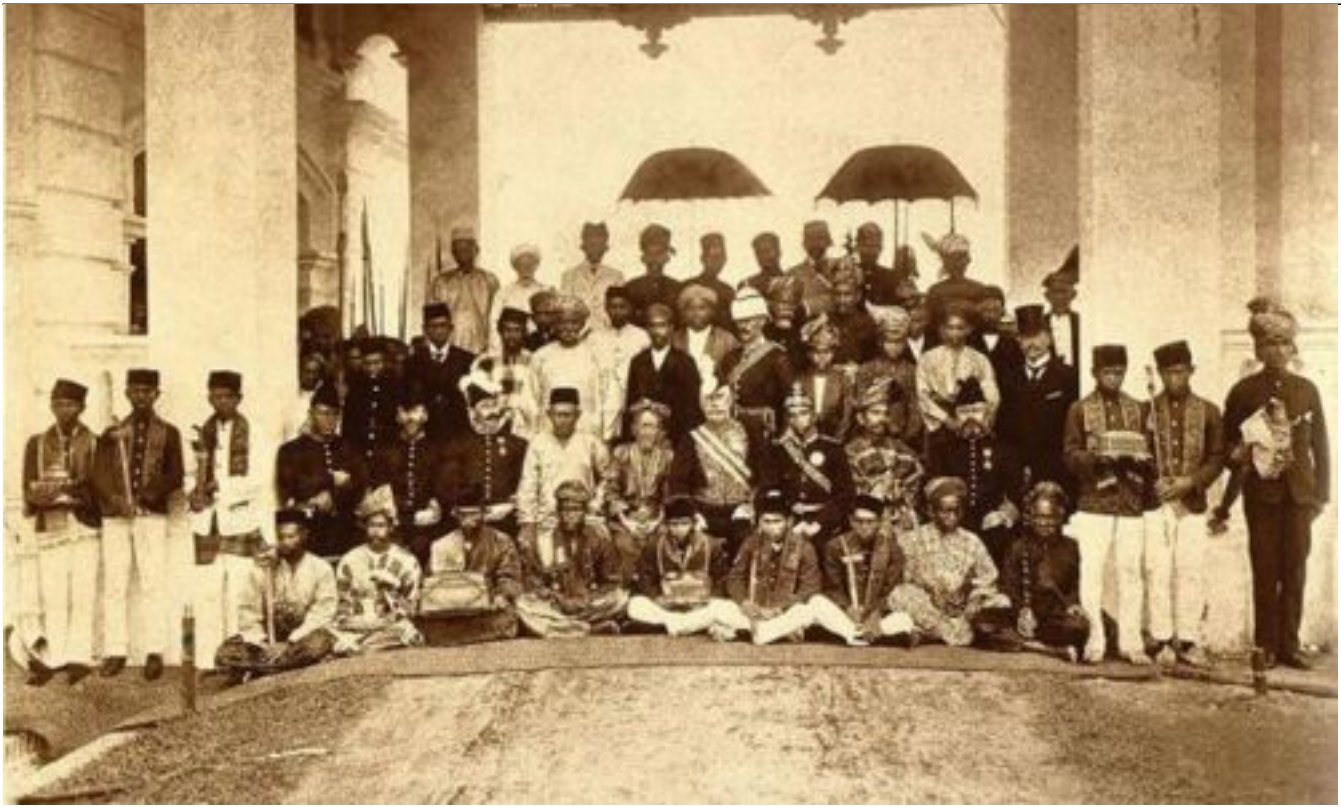
Pegawai British dan Sultan