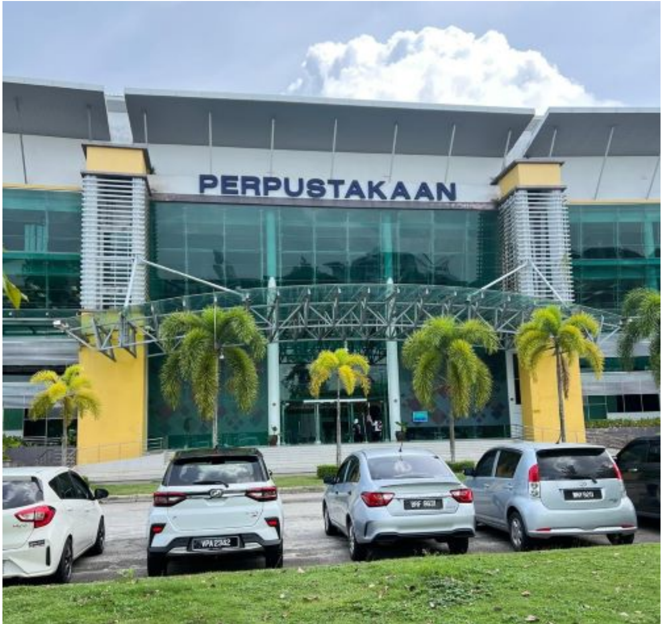
Universiti Gedung ilmu

Dalam era globalisasi di mana teknologi berkembang pesat, universiti teknikal bukan sahaja memainkan peranan sebagai pusat pembangunan ilmu dan inovasi, tetapi juga perlu mengambil peranan sebagai penjaga warisan bangsa agar tidak luput ditelan zaman.